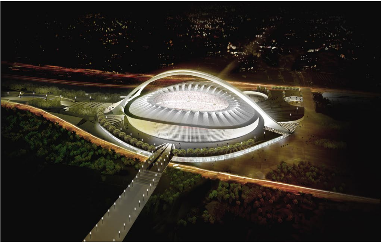
Das Kings Park Stadium in Durban wird von einem Bogen überspannt, der als „Skywalk“ unabhängig von Veranstaltungen im Stadion für Besucher geöffnet ist und einen spektakulären Blick auf die Stadt und den Indischen Ozean bieten soll.

schiedlichste Sport- und Freizeitmöglichkeiten. Das Stadion wird nach der WM eine Kapazität von rund 30.000 Plätzen haben, die während der WM durch mobile Tribünen um 10.000 Plätze erweitert werden soll. Das Budget des Stadionbaus liegt beim derzeitigen Wechselkurs bei €55-60 Mio.